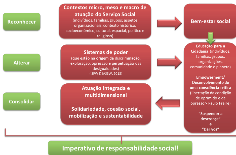
Figura 4. Implicações para a formação inicial em Serviço Social

Julgamos, assim, estar em sintonia com a definição de Serviço Social (IFSW & IASSW, 2014), não descurando a responsabilidade coletiva nesta análise. Associada à noção de responsabilidade coletiva, surge a de ação coletiva, ou seja a ação sociopolítica que o assistente social desenvolve em conjunto com os sistemas clientes no sentido da mudança social, ou seja, da mudança das estruturas que impedem o efetivo acesso dos mesmos aos recursos, oportunidades