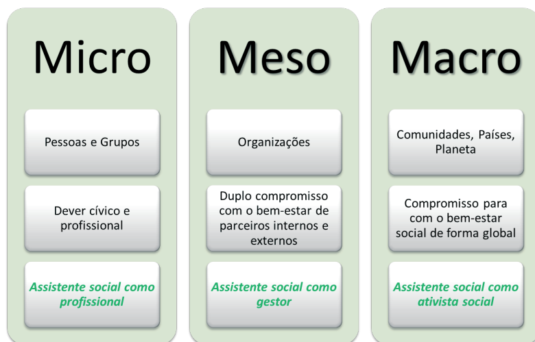
Figura 1. Escalas de responsabilidade social no Serviço Social

Na mais recente definição de Serviço Social da International Federation of Social Workers (IFSW) e da International Association of Schools of Social Work (IASSW) este é identificado como uma profissão de intervenção e uma disciplina académica que promove a mudança social e o desenvolvimento, a coesão social e o empowerment e libertação das pessoas. Os princípios centrais do serviço social são a justiça social, os direitos humanos, a responsabilidade coletiva e o respeito pelas diversidades. O serviço social envolve as pessoas e as estruturas sociais, suportado pelas teorias do serviço social, das ciências sociais, das humanidades e dos conhecimentos indígenas, de forma a dar resposta aos desafios sociais e melhorar o bem-estar (IFSW & IASSW, 2014).